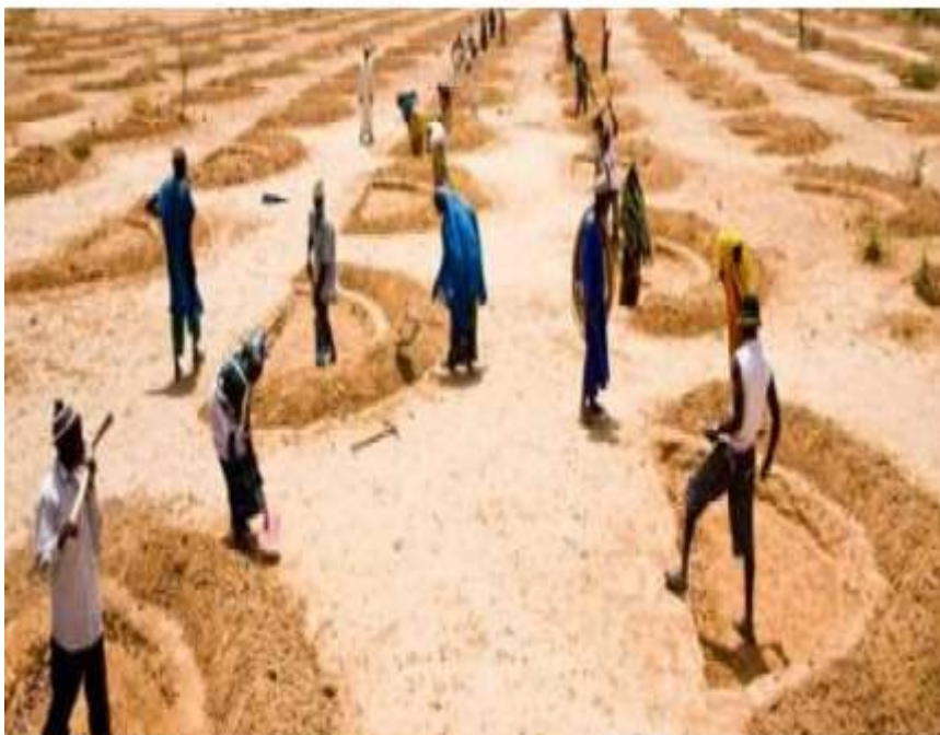
Figure 7 : Présentation de quelques difficultés climatiques au Niger