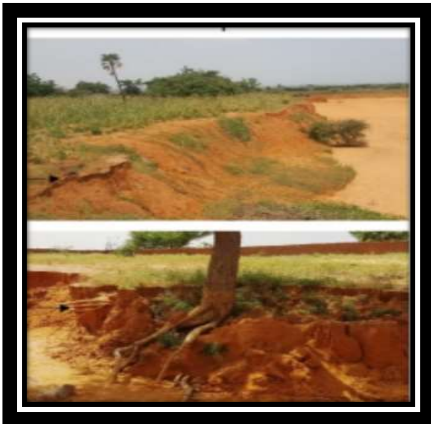
Figure 8 : Érosion de sols au Niger

Source : Adamou Salifou Noma , Gourfi Abdelali , Touré Amadou Abdourhamane , Daoudi Lahcen, 2022, « Érosion hydrique au Sud-ouest du Niger : impacts des facteurs naturels et anthropiques sur les pertes en sols », Géomorphologie, Open Edition Journals , Volume 28, Numéro 2 ,p.79.