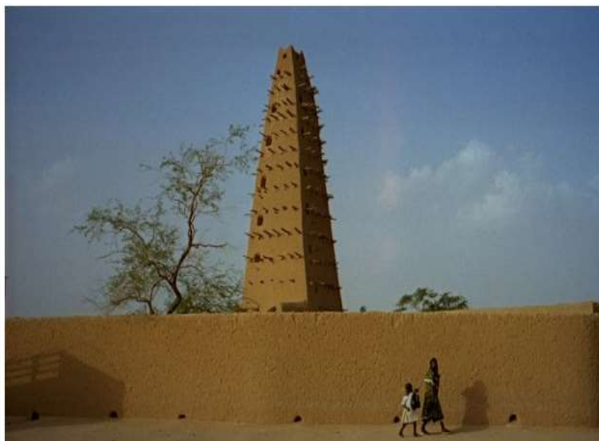
Figure 4 : La grande mosquée d'Agadez