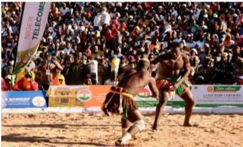
Figure 2 : le Kokowa