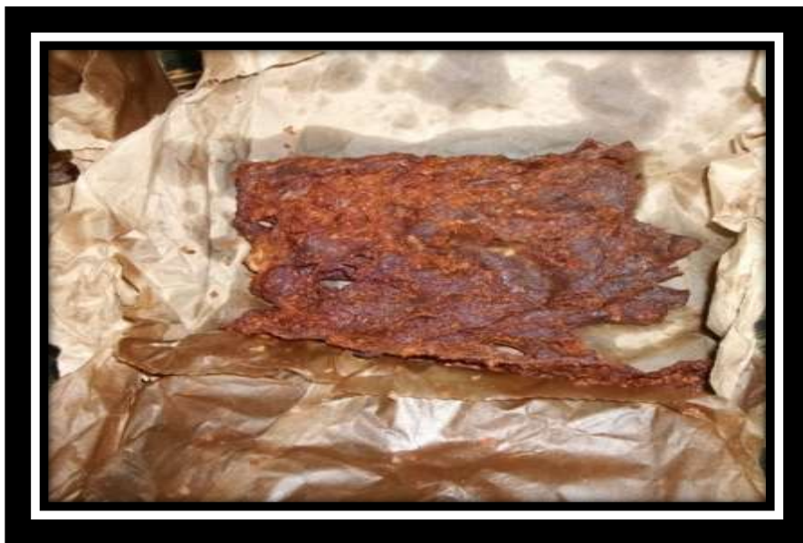
Figure 1: Exemple d'un met traditionnel nigérien : Le kilichi