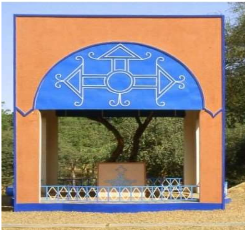
Figure 5 : Œuvre dans un musée à Niamey