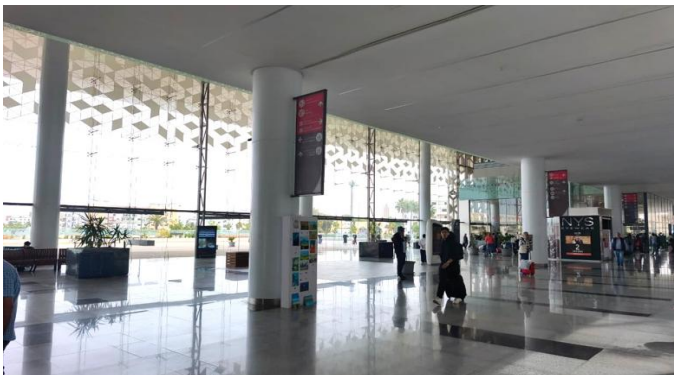
Figure 4. Relation entre verrière / façade vitrée et lumière naturelle dans le hall

Le rez-de-chaussée de la gare de Rabat-Agdal constitue le seuil de l'expérience spatiale. Plus qu'un simple espace de passage, il interroge la manière dont la configuration architecturale guide et influence le comportement des usagers. La transparence des parois vitrées et l'ampleur du volume ne se limitent pas à une impression d'ouverture (Fig. 4) ; elles posent la question de la relation entre visibilité et orientation perceptive, et comment la lumière naturelle structure la circulation tout en renforçant le sentiment de sécurité et de confort.