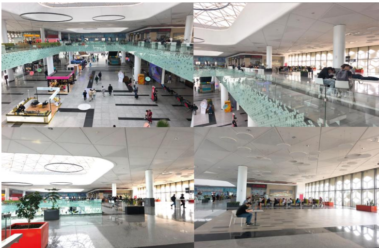
Figure 6. Espaces de restauration et de repos

court, à des cafés, à des commerces et à des lieux de repos. Cela qui permet aux voyageurs de faire une pause dans le flux de la mobilité. Plus calme et plus lumineux que les niveaux inférieurs, il permet de faire une coupure de rythme favorisant à la fois la contemplation et la sociabilité, la fluidité des circulations et une atmosphère bienveillante propice au repos comme à la transition.