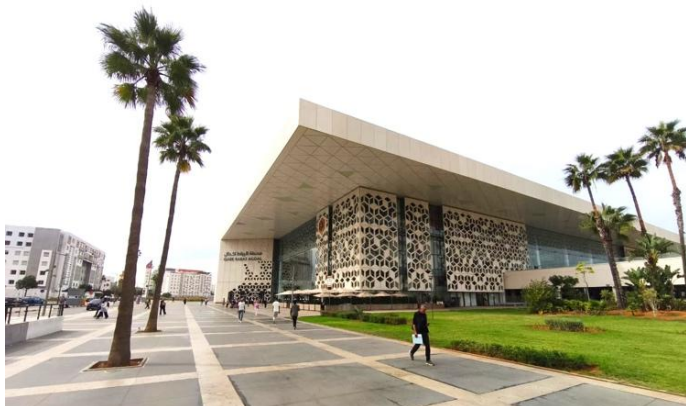
Figure 1. Vue générale de la gare dans son contexte urbain