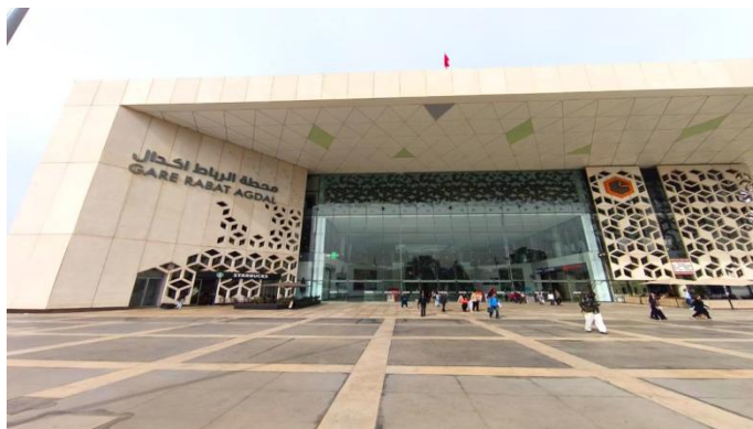
Figure 2. Façade principale

La façade principale (Fig. 2), ouverte sur le grand boulevard, se déploie selon une composition symétrique et lisible.